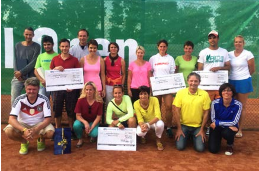
Die strahlenden Sieger der Kaiserstuhl Open 2014.

bei den 3. Kaiserstuhl Open um den CEWE Cup in Bahlingen.